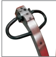
Mogelijk te werken met handvat in verticale positie. Alle controlefuncties gecentraliseerd.

Sterke constructie verzekert een lange levensduur en lage onderhoudskosten.