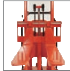
In de breedte instelbare vorken zijn verkrijgbaar als optie in verschillende lengtes en types.