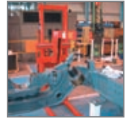
Verkrijgbaar met zijdelings kantelende vorken en/of opties zoals bv. kraanarm, level control, vatenkantelaar, afstandsbediening, ingebouwde lader.