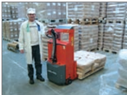
Optimale veiligheid dankzij transparant en schokbestendig veiligheidsscherm en verminderde rijsnelheid.